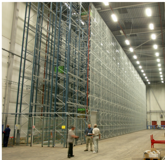
SafeStore von Axelent, Maschenweite 50x60 mm. Die abgebildete Anlage wurde bei Sapa Arendal, einem Zulieferpartner von Volvo, installiert.

Axelent-SafeStore ist die optimale Lösung für ein sicheres, attraktives und übersichtliches Lager. Die Befestigung von SafeStore an der Rückseite des Palettenregals verhindert, dass Waren herunterfallen und Verletzungen oder Materialschäden entstehen können.